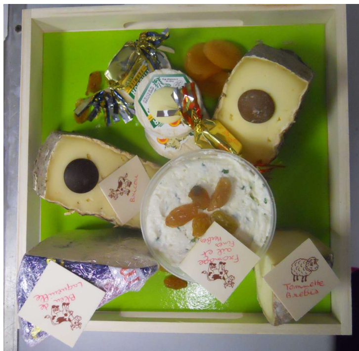
Idee de plateau de fromage

Nous vous invitons également à commander vos plateaux à l'avance.